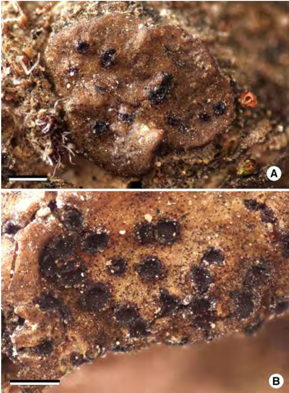
Fig. 3- Gelatinopsis heppiae .- A , escuámula joven de Heppia despreauxii , en la que se aprecian los ascomas emergentes de Gelatinopsis heppiae .- B , apotecios maduros de L. heppiae . Escalas. A y B = 0,5 mm.

prácticamente no existe. Por sus características, los ascos de G. leptogii son los que más se parecen a los de G. heppiae . En ambas especies, los ascos son cilíndricos o subcilíndricos, ligeramente