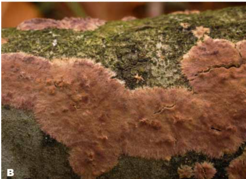
Phanerochaete crassa ; A. BIO-Fungi 12149. B. BIO-Fungi 12221.