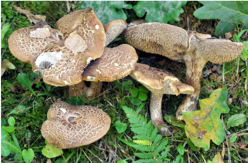
Sarcodon quercinofibulatum (holótipo).

especies de sombrero escamoso, que crecen, como en nuestro caso, bajo fagáceas, carecen de hifas fibulíferas. Conviene destacar que, en muchos casos, la observación de este tipo de hifas al microscopio óptico, no resulta nada fácil. Pero precisamente en nuestro caso, ocurre al revés, ya que no se trata de asegurar la ausencia de estas hifas, sino todo lo contrario, de constatar su presencia, que lo es en abundancia y de forma muy visible en todas las partes del carpóforo.