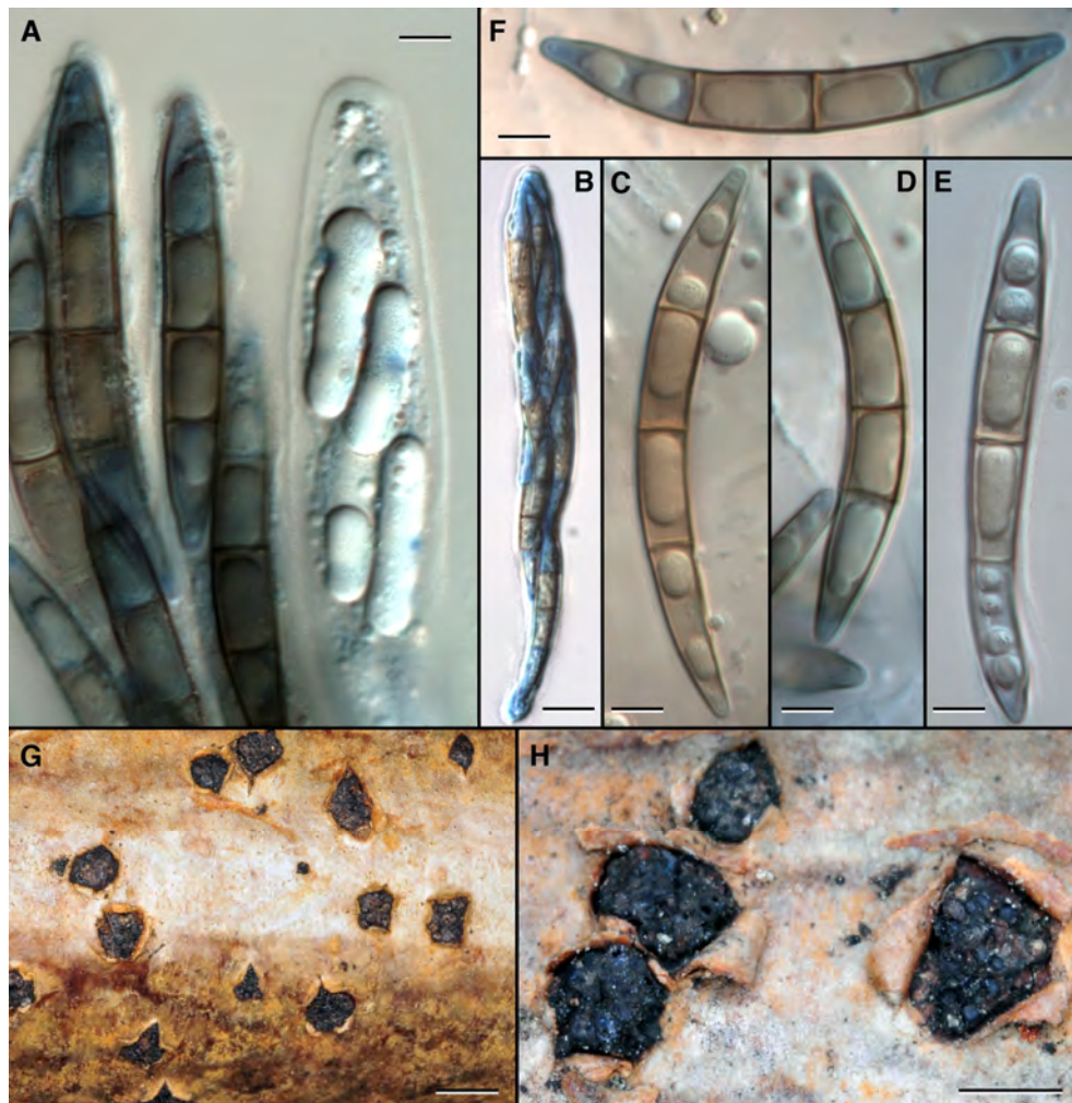
Fig. 2. Aspecte general, ascis i ascòspores de Melogramma campylosporum . A , ascis en diferents estats de maduració; a l'esquerra, dos ascis madurs amb la paret evanescent i les ascòspores ja madures, triseptades i pigmentades, i, a la dreta, un asc immadur, amb la paret clarament visible, i les ascòspores immadures, encara no septades, sense pigmentar, i amb una gran gota lipídica al seu interior. B , asc madur octosporat. C-F , Ascòspores madures, amb la pigmentació més marcada en les cèl·lules medials que en les apicals. G-H , Aspecte general dels estromes, que afloren trencant l'escorça de la planta suport.- A-F, preparacions muntades en lactofenol-blau cotó. Escales: A, C-F = 5 µm, B = 10 µm, G = 4 mm, H = 2 mm.

(ELLIS & EVERHART, 1892; LAFLAMME, 1976)) i es coneixen també citacions de Xina atribuïdes a aquest fong (TENG, 1934).