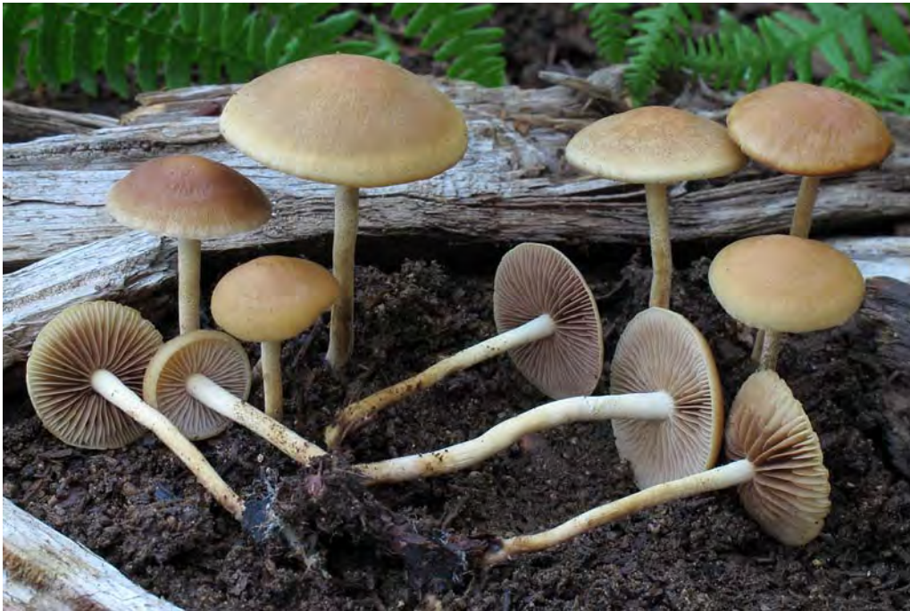
Agrocybe arvalis (Fr.) Heim & Romagnesi, basidiomas en tiempo seco.