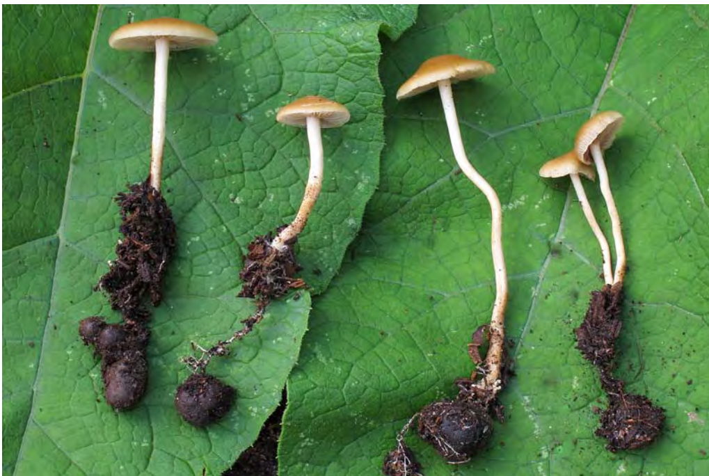
Agrocybe arvalis (Fr.) Heim & Romagnesi, detalle de los esclerocios