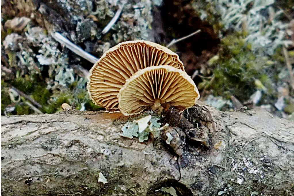
Pleuroflammula ragazziana . Isla de Monteagudo (Cíes).