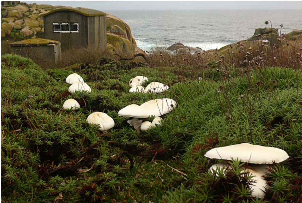
Agaricus crocodilinus . Isla de Sálvora.