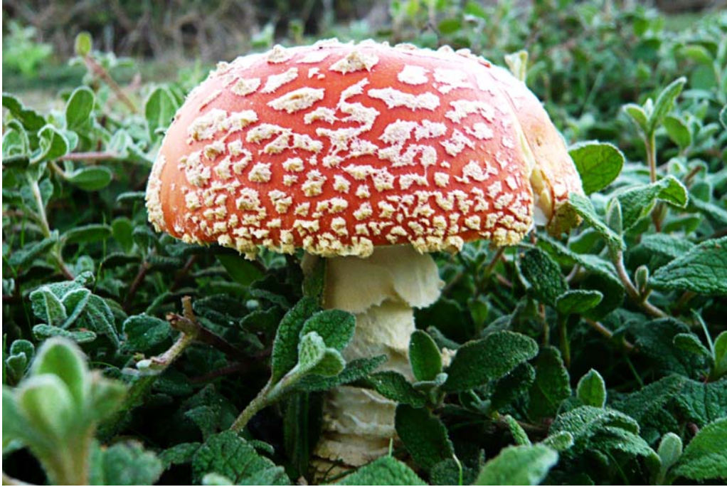
Amanita muscaria var. inzegae . Isla de Sálvora.