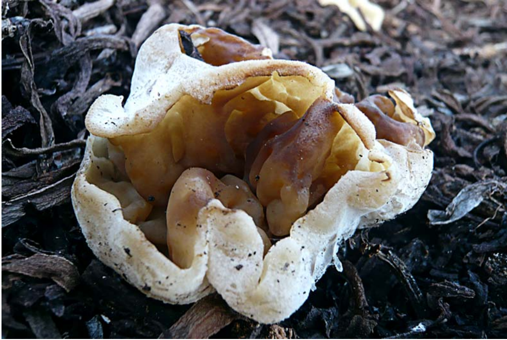
Peziza proteana f. proteana . Isla de Sálvora.