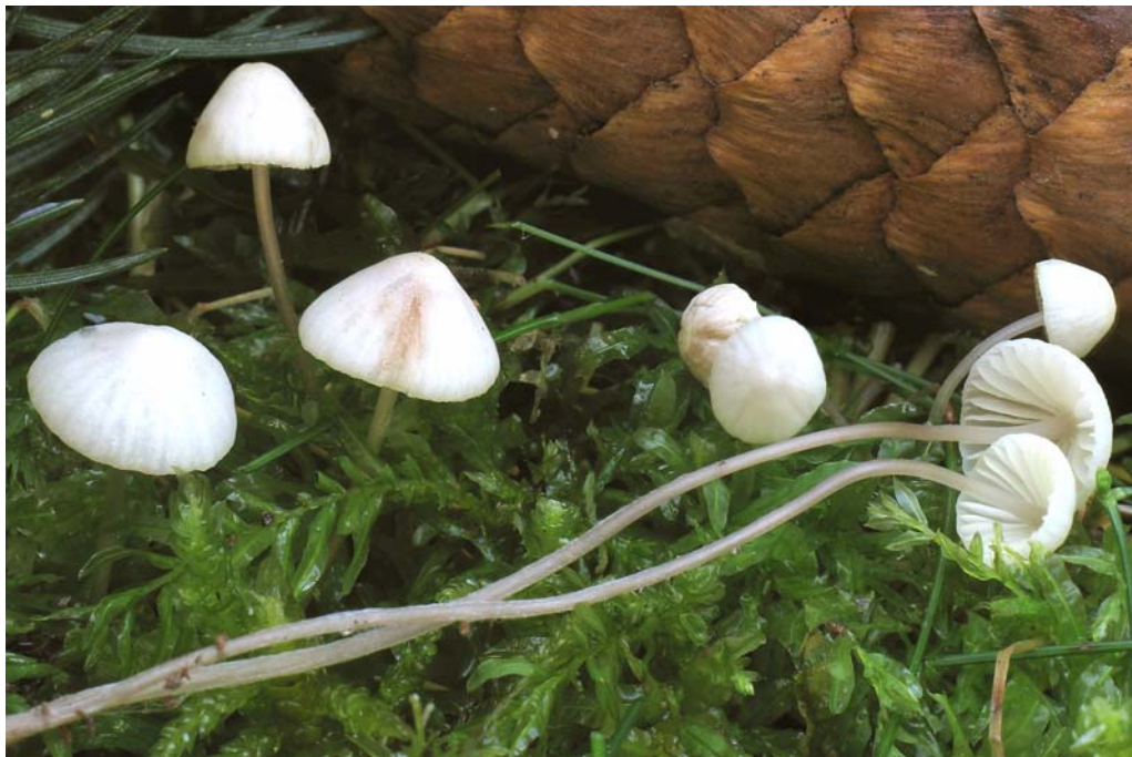
Mycena albida Robich (L. Sánchez)