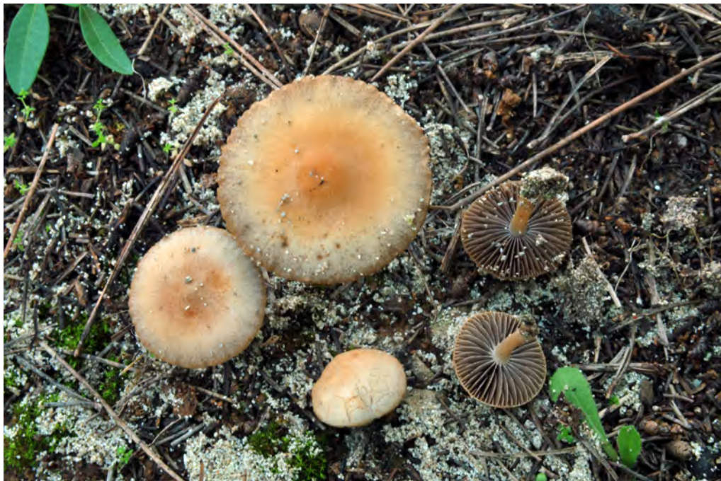
Psathyrella dunensis Kits van Wav. (JLS 3839).

OBSERVACIONS. Pot compartir hàbitat amb P. ammophila (Durieu & Lév.) P.D. Orton, però se'n diferencia perquè aquesta presenta espores de mides més grans, (10) 11-13,5 × 6,5-7,5 (8) µm, amb porus germinatiu de subtruncat a truncat, i diàmetre 1,5-2 µm, i cistidis molt versiformes. En canvi les nostres mostres presentaven les espores de 7,9-9,4 (10,3) × 4,6-6 µm, amb porus germinatiu més petit, 0,9 µm i cistidis més aviat lageniformes, caràcters compatibles amb P. dunensis ; sospitam que algunes citacions realitzades a les Illes Balears de P. ammophila puguin ser en realitat P. dunensis . Nova citació a les Illes Balears.