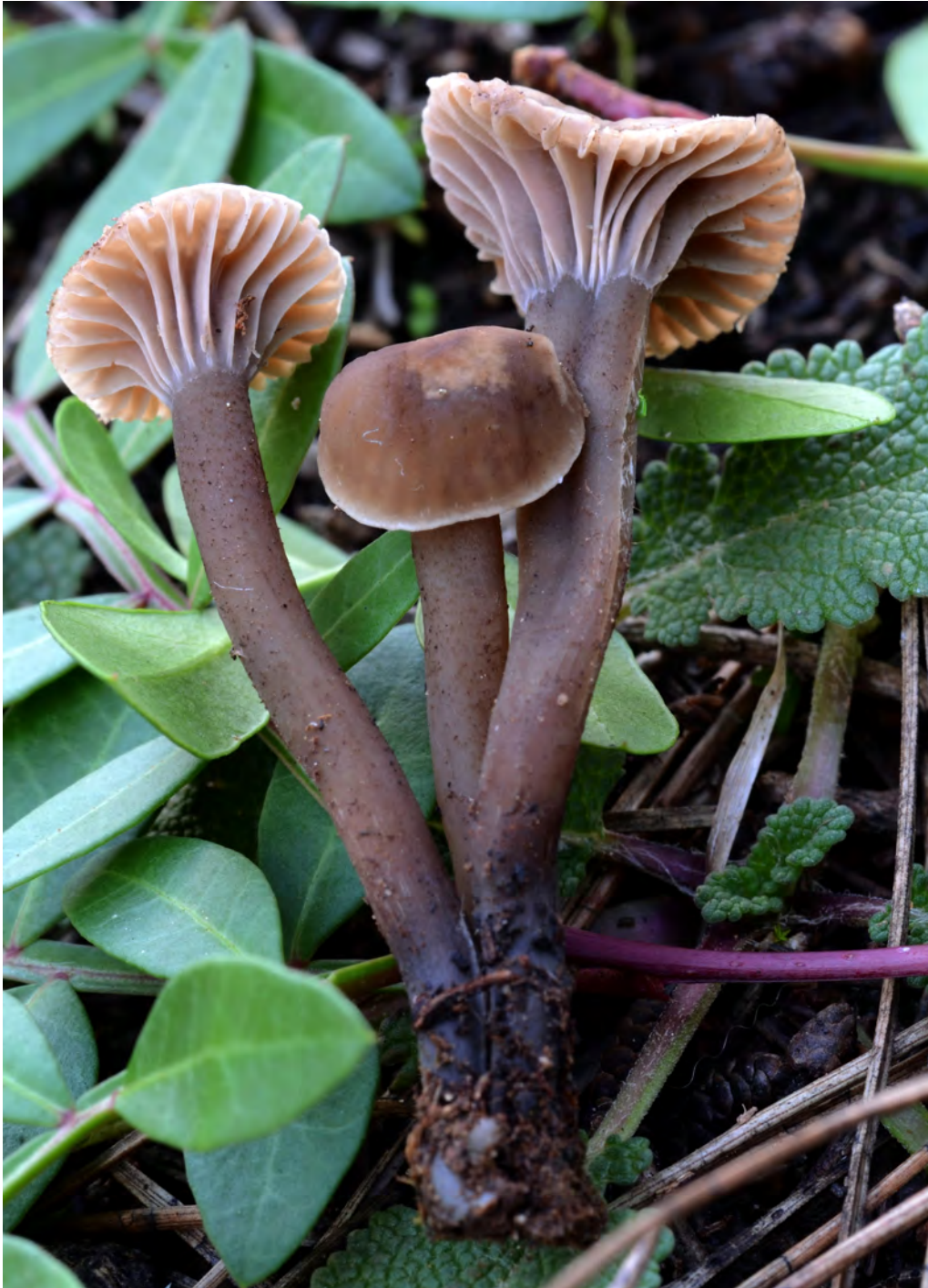
Camarophyllopsis foetens (W. Phillips) Arnolds (JCS 1311B).