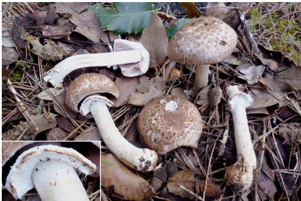
Fig. 2. - Agaricus freirei Blanco-Dios. Carpòfors (JLS-4002 i JCS-1493B)